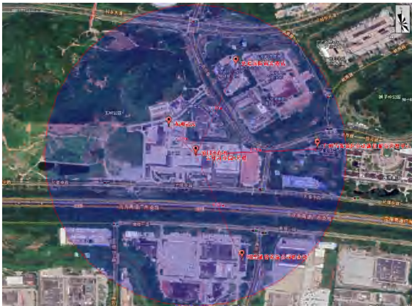
附图 3 建设项目周边环境敏感点图