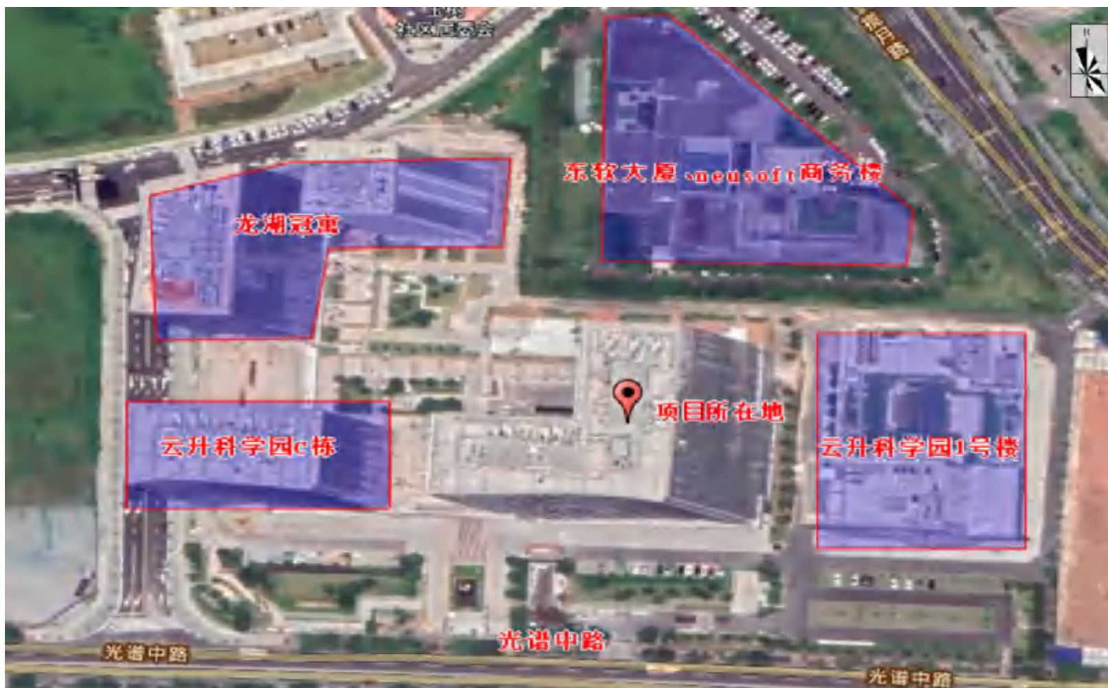
附图 2 项目四至情况图