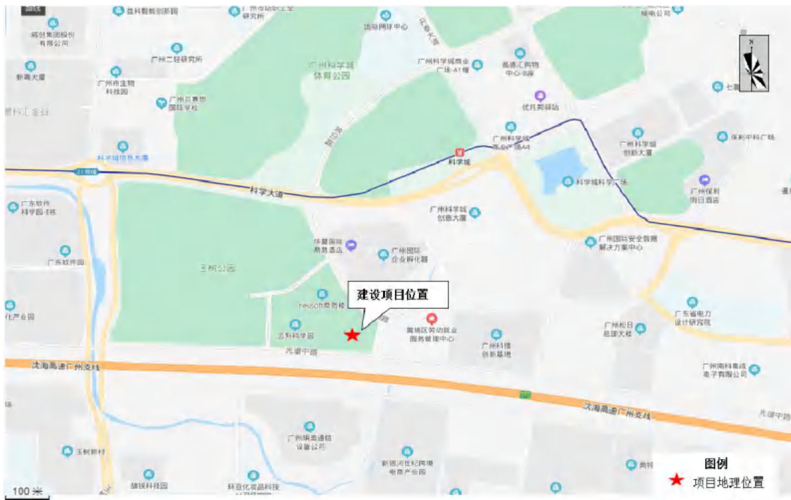
附图 1 项目地理位置图